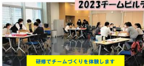
研修でチームづくりを体験します