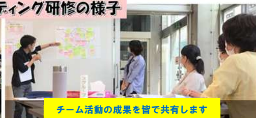
チーム活動の成果を皆で共有します

本研修では、同じ場で、お互いのことを語り合い、お互いから学び合うことを大切にしています