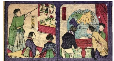
教育錦絵

動植物を描いた博物図譜や標本画について美術史の観点から研究しています。牧野富太郎とかかわりのあった画家・佐久間文吾や、魚類図を描いた伊藤熊太郎などについて調査をしています。