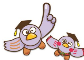
埼玉県マスコット「コバトン」と「さいたまっちゃん」

大学HPにも公開講座・Web講座など多くの情報が掲載されておりますので、ぜひご覧ください